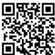
エアロデザイン ファクトリー ホームページ