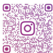
エアロデザイン ファクトリー Instagram