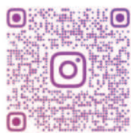
エアロデザイン ファクトリー Instagram