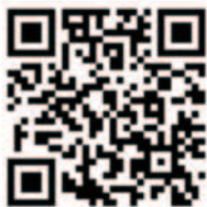
エアロデザイン ファクトリー ホームページ